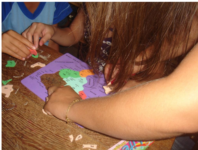
Figura 4. Alunos localizando o estado do Mato Grosso, no mapa do Brasil.

Assim percebe-se um grande desenvolvimento cognitivo dos discentes perante a interpretação de mapas, compreensão da realidade, e visão de mundo diferenciado das crianças que não estão acostumadas a utilizar o mapa.