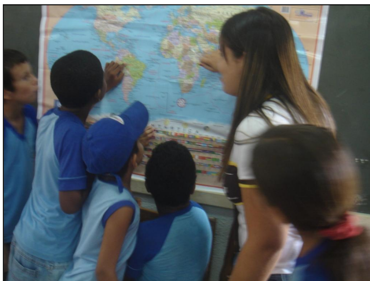
Figura 3. Alunos utilizando mapa nas aulas de geografia

Com a frequência da utilização de mapa nas aulas de geografia (Figura 3), ocorreu uma grande evolução da turma perante a interpretação dos mapas, os alunos executaram trabalhos de representar em um mapa o caminho de casa até a escola, por meio deste, a partir da convivência com os discentes, e outros trabalhos propostos, observou-se que a maioria conseguiu localizar-se, tal que, conseguiram entender que moram em Juína, e a cidade está localizada no Estado do Mato Grosso e que está no Brasil (Figuras 4).