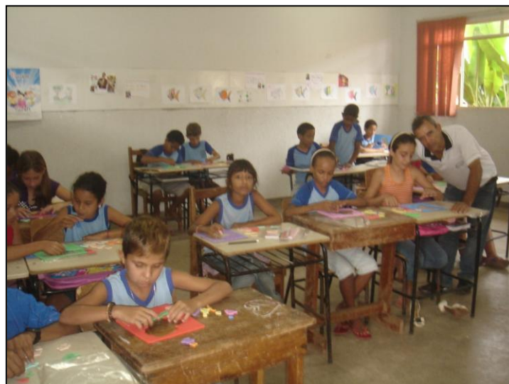
Figura 2. Alunos da 2ª Fase do 2º Ciclo "A" com o professor da turma