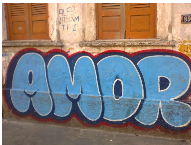
Figura1- Grafite na R. Carlos Gomes

Uma das nossas primeiras estratégias foi entender o lugar como define Santos (1996), “Cada lugar é a sua maneira do mundo. (...) Mas, também, cada lugar, irrecusavelmente imerso numa comunhão com o mundo, torna-se exponencialmente diferente dos demais. A uma maior globalidade, corresponde uma maior individualidade”.