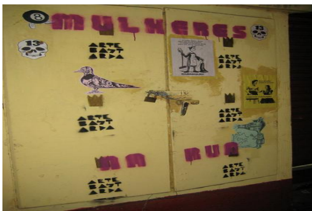
Figura 5- stencil no centro de Salvador