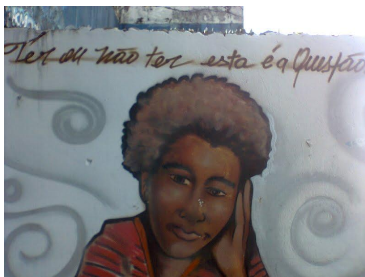
Figura 2- Grafite na Av. 7 de setembro, Centro, Salvador

Para Lopes (2009) “O graffiti marca o corpo da cidade, com inúmeras mãos desejosas, deixando-o carregado de um desejo que se fez realidade. Mesmo que efêmero.” Desta forma, o grafite se configura como a expressão de um movimento político pois o lugar de onde os grafiteiros vêm – periferias pobres, conjuntos habitacionais, bairros populares – estará marcado em cada pintura (Figura 2), em cada ação. E a partir da associação de vários grafiteiros é possível a inserção de mais jovens no processo. Como nos diz Afro, morador da comunidade popular Bairro da Paz: “Em dois mil e cinco eu dei oficina no bairro da paz e até hoje tem alunos que grafitam e que estão fazendo... A arte modifica, a arte transforma; de qualquer forma, eu acho sim que tem um poder de transformação.”