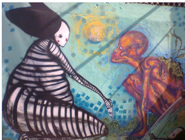
Figura 3- Primeiro tipo predominante

O primeiro é uma pura expressão de cores, texturas e linhas. Não há mensagens textuais, não há muito o que interpretar. É, basicamente, experiência estética, preocupação com beleza, traços e formas. Não deixa de ser, no entanto, uma intervenção política, pois exprime uma outra subjetividade, uma outra forma de experimentar a cidade; rompe-se com a ordem dos muros cinzentos e sem vida. O segundo tipo apresenta personagens e cenas do cotidiano, sem abrir mão da preocupação estética, mas incluindo mensagens escritas. Nessa forma de grafite, as críticas sociais são expressas claramente, sejam elas endereçadas ao racismo, às desigualdades ou à alienação.(Souza, 2004, p. 107)