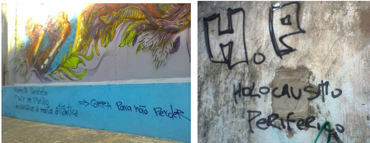
Figura 4 – Segundo tipo predominante