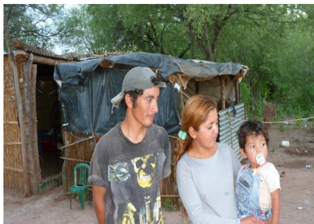
Foto 1. Residencia de matrimonio joven migrante en Santiago del Estero.

Se observa la preponderancia de la residencia rural por sobre la urbana, sin embargo vemos que esa residencia no es decisiva en los porcentajes que expresan las otras variables. Los migrantes urbanos tienen un poco más de ocupaciones a lo largo del año que los rurales. Esto tal vez se explica por la ausencia de tierra para el trabajo y por ende con la necesidad de permanecer en el mercado de trabajo. No obstante, la residencia rural no determina menores meses de asalarización para los migrantes, ya que 7 de cada 10 trabajan fuera de su residencia por más de 6 meses en el año. Este resultado convalida la idea de hogares rurales de asalariados y por otro lado la baja incidencia de la actividad agropecuaria como fuente de ingresos en este perfil de trabajadores. Por lo tanto, las cuestiones de mutación laboral como las alternativas de ofertas del mercado de trabajo resultan ineludibles para comprender la subsistencia y reproducción de este tipo de mano de obra.