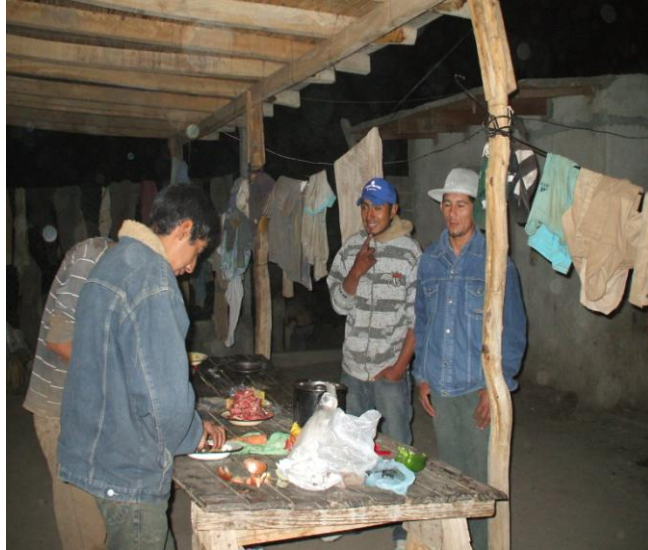
Foto 2. Trabajadores preparando su cena al regreso de una intensa jornada de trabajo.