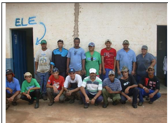
Foto1: Associados da ACAMART

A necessidade de se fortalecer o grupo em associação, após as ações estabelecidas e colocadas em prática no município fez com que fosse criada em março de 2007, a Associação dos Catadores de Materiais Recicláveis de Martinópolis (ACAMART), inicialmente contando com 11 pessoas das quais fazem parte ex-catadores e ex-desempregados, sendo todos escolhidos a adentrar a associação mediante assembléias entre os próprios.