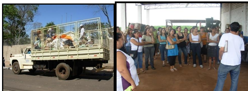
Fotos 5 e 6: Caminhão cedido pela Prefeitura para ACAMART realizar a coleta seletiva diária. Palestra para professores na sede da ACAMART