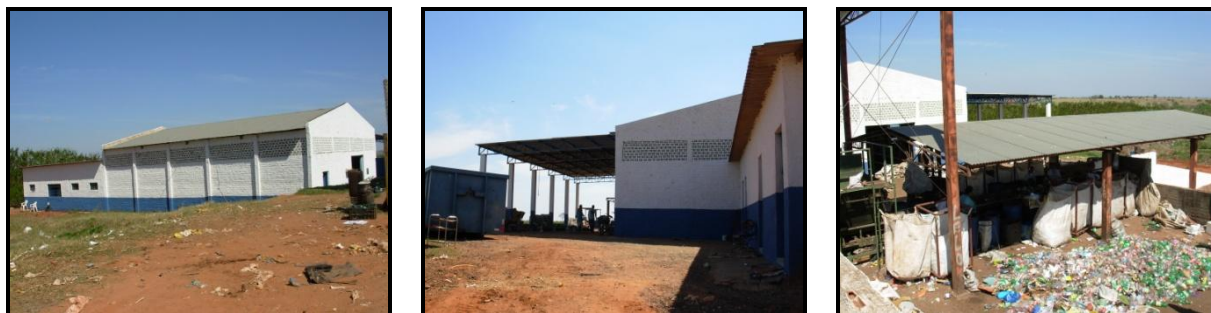
Fotos 2, 3 e 4: O prédio da Usina de Reciclagem e Compostagem onde os associados trabalham.

também usufruísse a infra-estrutura da Usina de Reciclagem e Compostagem 1 do município, a qual possui galpão para armazenamento e desenvolvimento das atividades de separação, banheiro, vestiários, cozinha, sala para reunião, dentre outros, e maquinário – caminhão, esteira, prensa e trator.