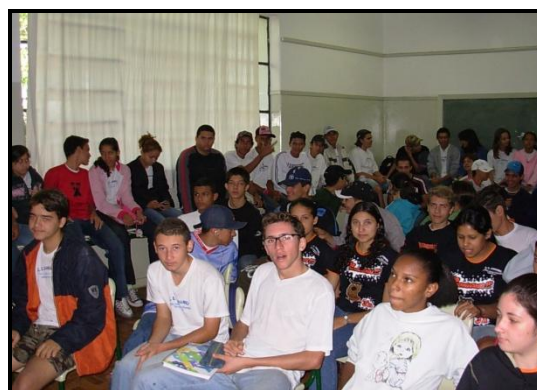
Foto9 e 10: Educação Ambiental nas escolas de ensino fundamental e médio.