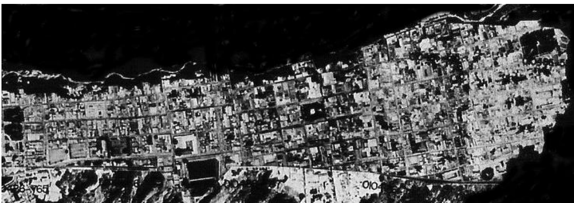
Figura 2: Espacio Físico Construido del Casco Central, 1997.