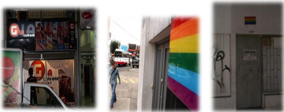
Imagen 11. El Bar Gia y otros dos bares , de la zona caracterizan los rasgos visuales de los ambientes LGBT (Imágen de archivo personal, 2010).