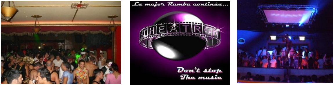
Imagen 1. TheatrondePelicula.(Imágenes de archivo personal)

Theatron de película desde hace 10 años se ha convertido en el icono de la rumba gay en la capital del país, un establecimiento que ocupa una cuadra completa, hace de este bar temático, uno de los más grandes de Suramérica en este tipo, con 8 ambientes de diferentes estilos musicales para todo tipo de gusto, conllevan a que sea el máximo referente y en la mayoría de los casos el causal por el cual se inicia una toma de la UPZ99 como una zona LGBT por excelencia, desde su creación la configuración de los espacios LGBT fueron creciendo alrededor suyo, tomándose las cuadras aledañas como se ve actualmente.