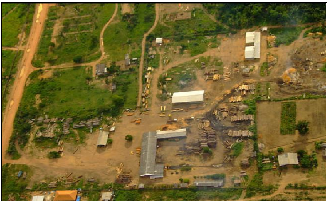
Fig. 02: Indústrias madeireiras em Santo Antônio do Matupi – BR 230 (zona rural de Manicoré (AM)).

A indústria madeireira cresceu acentuadamente na região. A construção das estradas, abriu caminho para exploração intensiva da floresta, na maioria das vezes totalmente contrárias às legislações trabalhista, fiscal e ambiental. Os municípios de Apui e Manicoré foram os que mais tiveram suas florestas destruídas na Micro Região Madeira. Em Manicoré, o distrito de Santo Antônio do Matupi localizado às margens da BR – 230 possui mais de vinte (20) madeireiras.