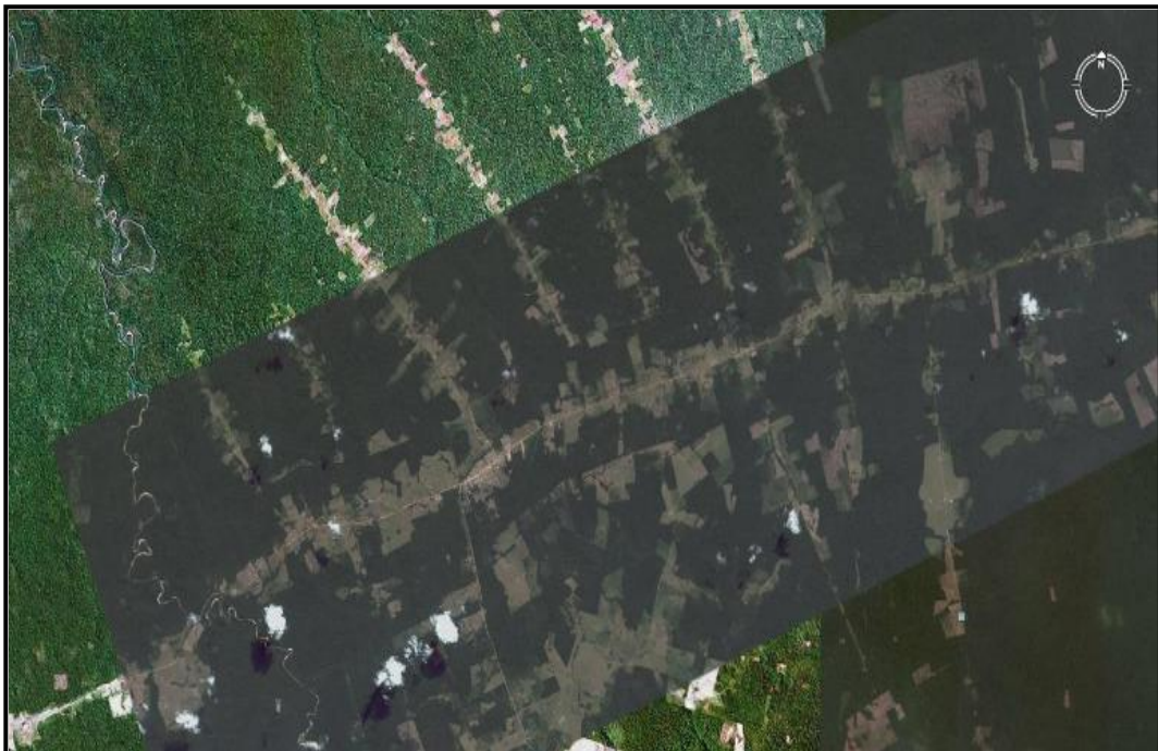
Fig. 05: Projeto de Assentamento Matupi – km 180/BR – 230 (Transamazônica) Manicoré (AM).

A instalação de projetos de colonização implementados às margens das rodovias federais colaborou com abertura de novas áreas para prática da agricultura e pecuária. Além de ter influenciado na exploração desenfreada de madeira. Os assentamentos na Amazônia no período militar foram pensados para solucionar a questão das disputas por terras no sul e sudeste do Brasil e também para a ampliação de novas fronteiras agrícolas em regiões que, até então, para os governos eram consideradas vazias, como as áreas da região do Rio Madeira. Tal objetivo foi um caminho para a exploração acentuada da floresta o que trouxe taxas de desmatamento elevadas e problemas sociais de grandes proporções.