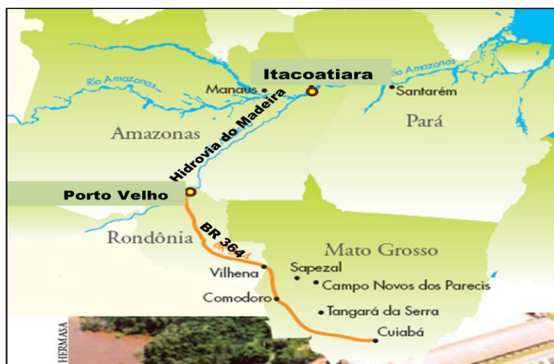
Fig. 03: Percurso do transporte de grãos pela Hidrovía do Rio Madeira. Fonte: Castro (s/d). Adaptação: Jacilene Oliveira/2010

A implementação da hidrovía foi uma parceria do governo do Amazonas com um grupo empresarial do agronegócio. Parceria que para o grupo trouxe grandes vantagens, pois se tornou muito mais viável economicamente o uso do Rio Madeira como opção de escoamento de sua produção. A produção vinda do Mato Grosso chega a Porto Velho pela BR 364, seguindo por barcaças até o porto de Itacoatiara.