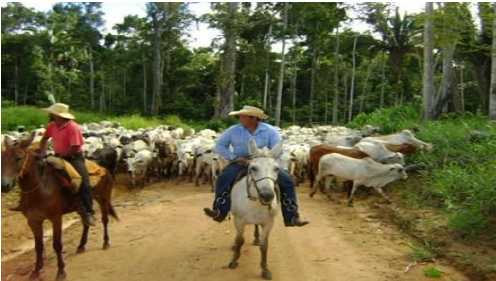
Fig. 01: Criação de gado em Santo Antônio do Matupi (BR – 230, zona rural de Manicoré – AM).

O apoio dado à expansão da agropecuária fez com que empresários vindos de outras partes do Brasil ampliassem seus negócios nos espaços naturais ao longo do Rio Madeira, recebendo incentivos para explorar a região. Enquanto isso, a população rural residente não foi inserida em tais políticas, em detrimento dos empresários do setor agropecuário de quem os projetos governamentais esperavam grande contribuição para o crescimento econômico do país.