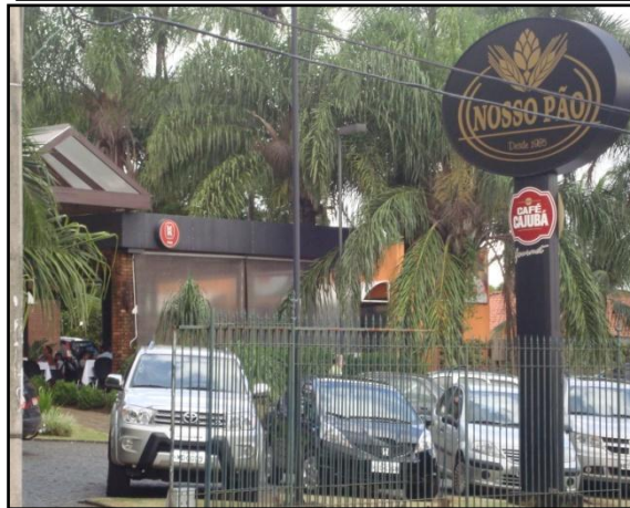
Figura 2 – Serviços disponíveis na zona Sul – Bobstore, Padaria Nosso Pão