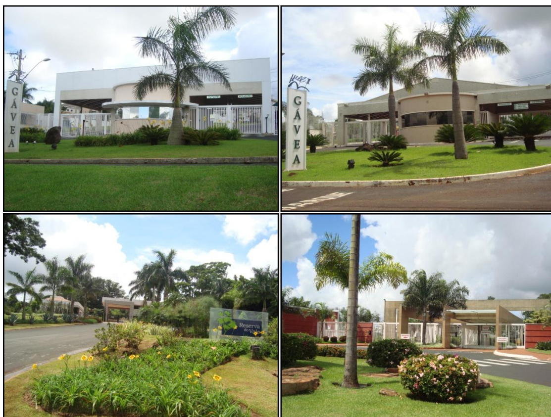
Figura 3 – Condomínios Fechados – Gávea Hill I, Gávea Hill II, Reserva do Vale e Bosque Karaíba

A zona Sul da cidade de Uberlândia é uma região que possui uma intensa diferenciação sócio-espacial, visto que a mesma comporta tanto os bairros de mais alto status da cidade (lado oeste do setor), quanto bairros voltados para a população de baixa renda (lado leste do setor). Essa diversificação social e econômica pode ser observada pela presença dos mais luxuosos condomínios residenciais que passaram a ocupar o setor desde os anos 1990, os quais agregam status socioeconômico e a crença de uma vida mais segura no interior dos muros que os cercam. Dentre dos principais condomínios presentes na zona Sul destaca-se o Gávea Hill I e II, Vila do Sol, Reserva do Vale, Jardins Roma, Jardins Barcelona, Bosque Karaíba, Santa Paula Royal Park Residence , dentre outros (Fig 3).