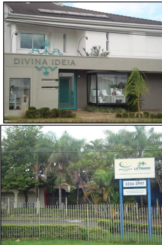
Figura 3 – Serviços disponíveis na zona Sul - Divina Ideia e Hotel Escola Bebê Conforto