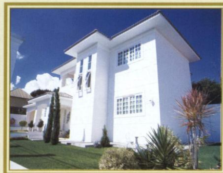
A casa que você sempre sonhou em um lugar privilegiado pela natureza.