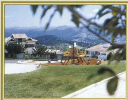
Projeto paisagístico e recreativo.

Os empreendimentos são entregues com os estatutos e regulamento interno da associação de proprietários implantados. Um investimento único, onde você só acumula vantagens: você ganha na rentabilidade do terreno, ganha com a preservação do meio ambiente e ganha um ótimo lugar para morar.