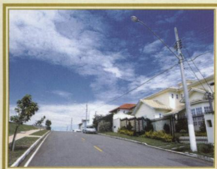
O melhor padrão tecnológico e total infra-estrutura.