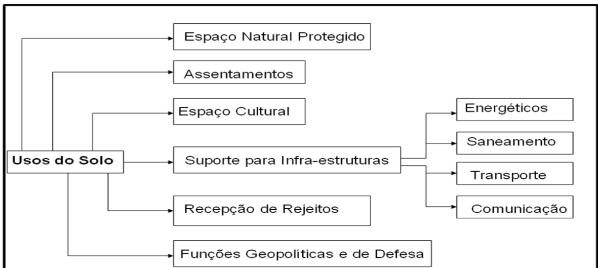
Figura 3. Usos do solo do litoral.

O litoral como subsistema jurídico-administrativo tenta regular as relações entre os dois outros subsistemas. As questões associadas ao caráter público da costa, as intervenções privadas do litoral, os modelos de gestão, a