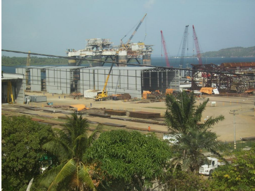
Figura 2 – Foto do canteiro de obras em São Roque, com a plataforma P-14 em reforma, ao fundo.

Acervo: Carlos E. L. Santos, em 28/12/2009