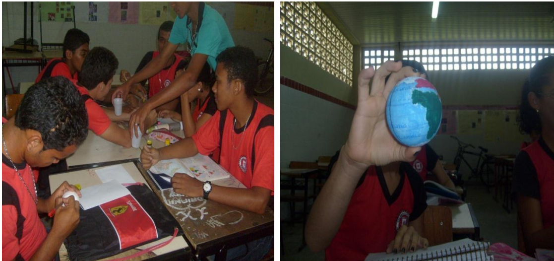
Imagem 03 e 04 – Alunos realizando a atividade lúdica Brincando e representando