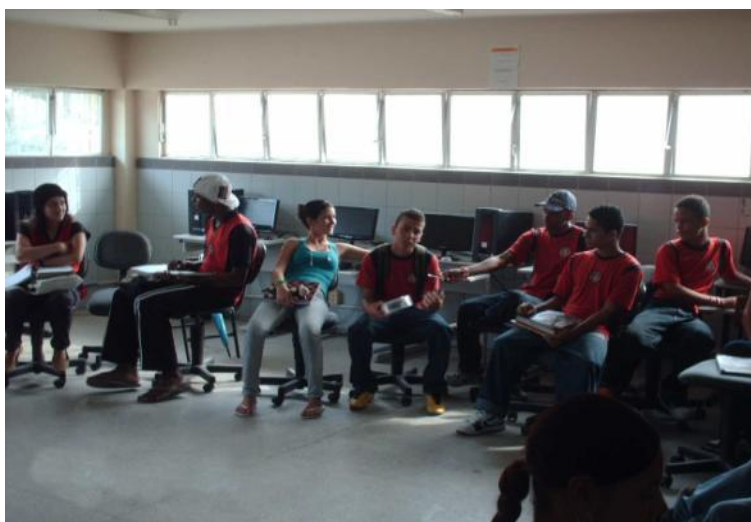
Imagem 01- Alunos participando da oficina “Chuva de Idéias”

Assim, iniciamos a oficina disponibilizando para os alunos uma caixa contendo palavras temáticas referentes aos aspectos geográficos como clima, vegetação, agricultura, população, hidrografia, economia, etc. Colocamos uma música para tocar e quando esta parava o discente que tivesse com a caixinha na mão retirava um dos papéis. O objetivo desta dinâmica era analisar o conhecimento prévio do aluno a partir do comentário dado sobre a temática sorteada, de modo que relacionassem o seu saber com as informações que foram transmitidas pelos vídeos e imagens.