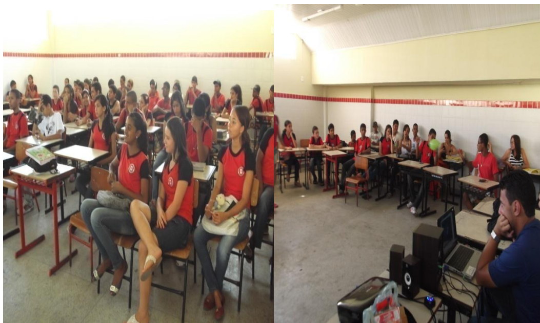
Imagem 06 e 07 – Alunos assistindo e participando da atividade lúdica

Os alunos formaram um círculo com as carteiras na sala, onde foram repassadas entre eles bexigas cheias de ar que continham perguntas com os temas que foram abordados pelos estagiários, ao som das músicas. No momento em que a música parava de tocar o discente que estava segurando a bexiga a estourava e fazia a leitura para então respondê-la. Quando o educando acertava a questão era premiado com doces de origem africana. Quando os alunos não sabiam responder, então reforçávamos retomando a explicação novamente.