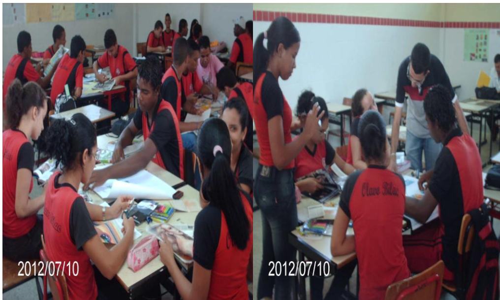
Imagem 03 e 04 – Alunos confeccionando os cartazes

outros. Posteriormente, explicamos aos alunos para recortar imagens dos materiais fornecidos de forma a montar os cartazes relacionando e identificando as figuras escolhidas com os conceitos geográficos de Lugar, Região e Paisagem ao passo que estaríamos ali para auxiliar e tirar dúvidas que surgissem entre eles.