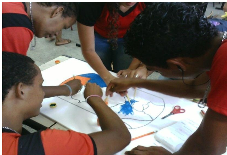
Imagem 06 – Discentes representando na maquete as principais placas tectônicas

O Grupo 2 desenvolveu uma maquete representando as principais placas tectônicas do planeta. Os materiais utilizados foram E.V.A, tesoura, tintas e pincéis.