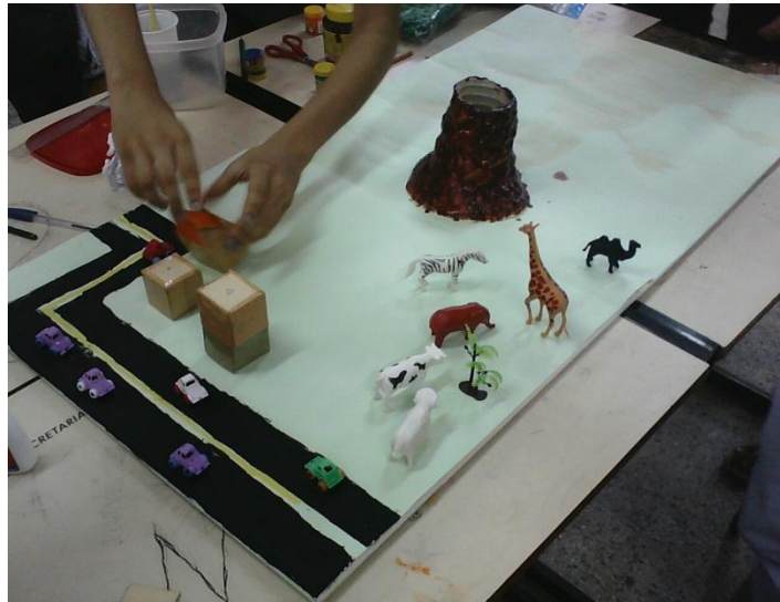
Imagem 05 – Alunos construindo a maquete de vulcão

Na segunda parte da oficina foram executadas as seguintes experiências. A turma foi dividida em três grupos e cada estagiário ficou responsável por coordenar uma equipe. O Grupo 1 realizou a construção de uma maquete em que fizeram um vulcão em erupção, como objetivo de facilitar a compreensão do funcionamento da estrutura interna da Terra e o significado ou a importância do estudo dessas temáticas na disciplina.