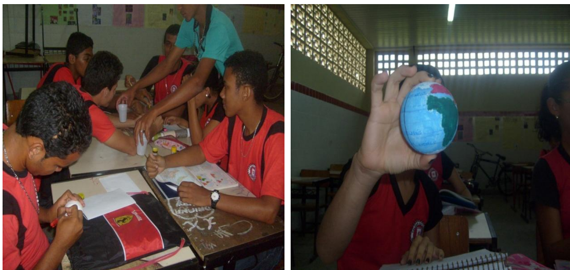
Imagem 03 e 04 – Alunos realizando a atividade lúdica Brincando e representando