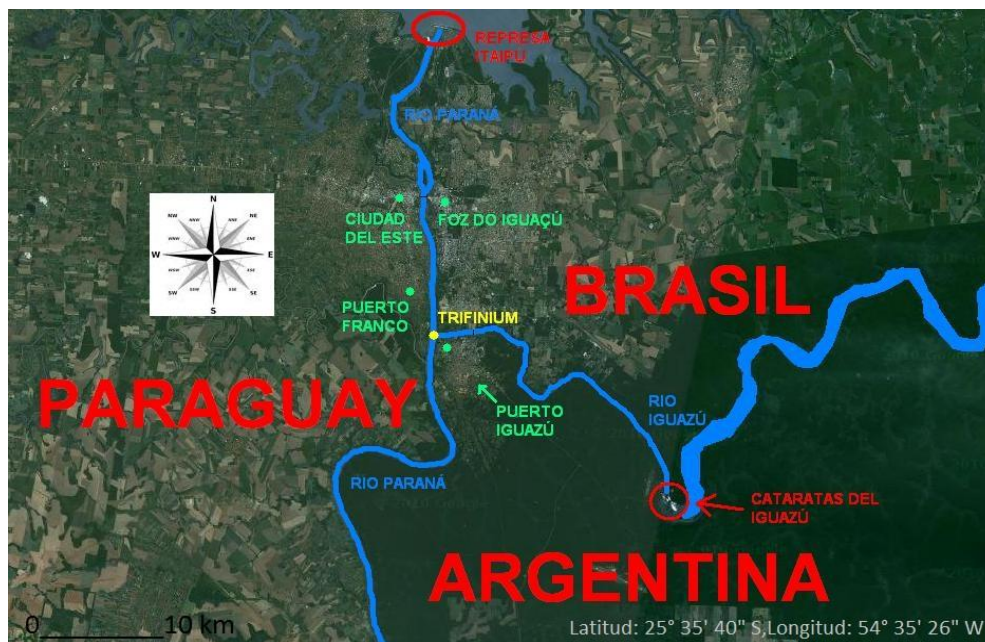
Figura. 1. Imagen satelital de la Triple Frontera.

La intersección en donde confluyen los tres países (Argentina, Brasil y Paraguay) es un espacio que existe en la imaginación del que la observa y que va más allá de los límites políticos-administrativos de las fronteras de los tres países, en donde estos participan como actores indiscutibles.