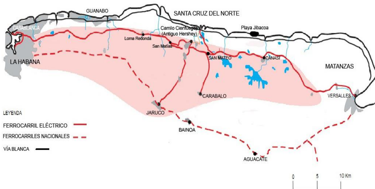
Figura 2. Ubicación geográfica del trazado ferroviario.

En la construcción del pueblo de una extensión de 28 hectáreas, el empresario norteamericano Milton Hershey recreó, en 1916, en territorio cubano sus experiencias de Pennsylvania (EE.UU.), donde había fundado un pueblo anexo a su empresa chocolatera, a partir de los criterios urbanísticos establecidos por el movimiento de “Pueblos Modelos”, en auge desde finales del siglo XIX en Norteamérica, cuyas premisas establecían brindar una serie de facilidades de servicios comunitarios a sus pobladores, así como el carácter autosuficiente de estos conjuntos urbano- industriales, tales principios fueron aplicados en la creación de este poblado en Cuba.