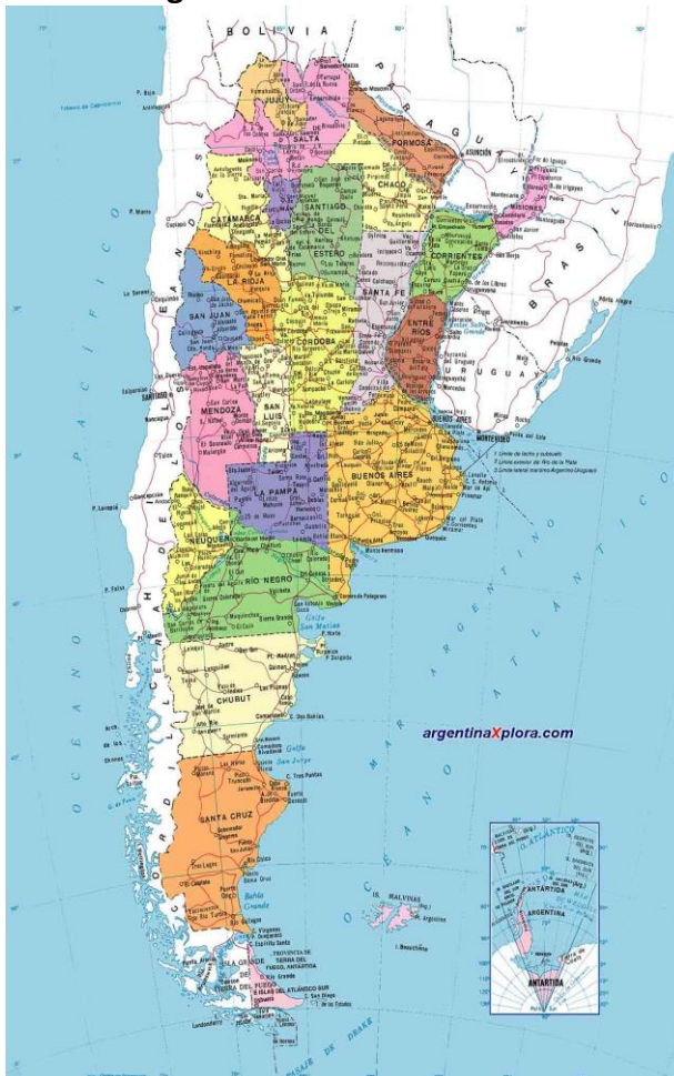
Mapa político de Argentina.