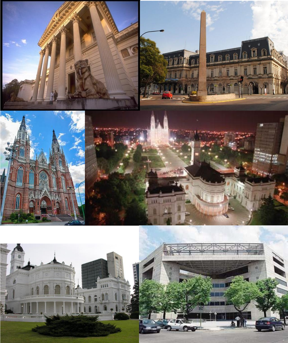
De izquierda a derecha: 1)- Museo de Ciencias Naturales, 2)- Pasaje Dardo Rocha, 3)- Catedral, 4)- Vista nocturna de Plaza Moreno, 5)- Palacio Municipal y 6)- Teatro Argentino.