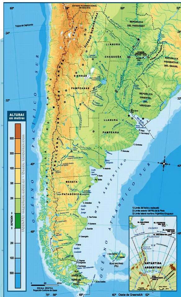
Mapa físico de Argentina.