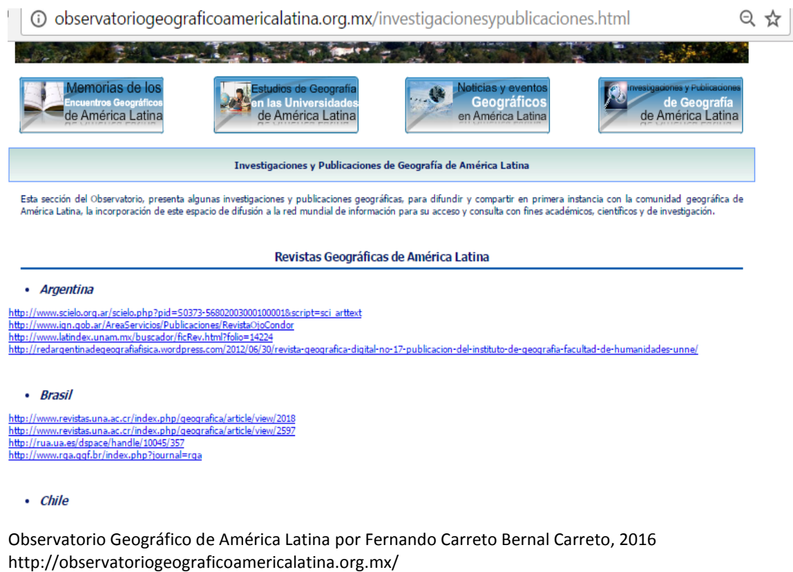
Imagen 4 Relación las revistas geográficas de AL con acceso en línea

Se encuentran 35 revistas de contenidos geográficos en repositorios como SCIELO, REDALYC, LATINDEX, con acceso abierto y registro en Creative Commons.