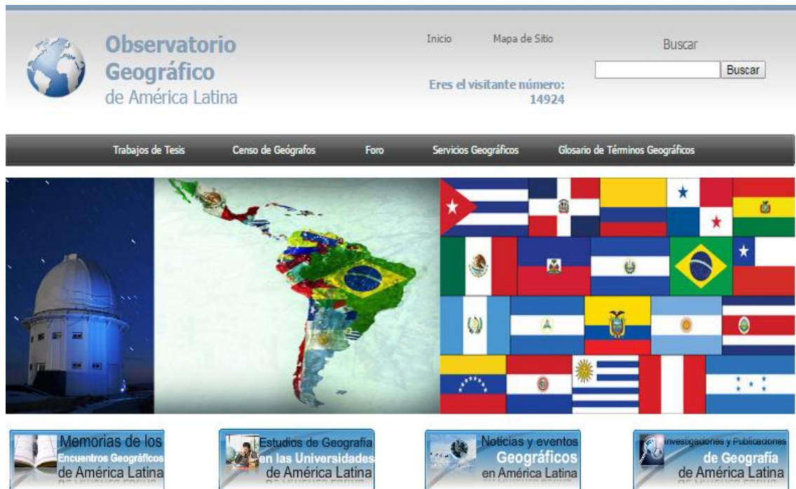
Imagen 5 Acceso a la consulta al observatorio