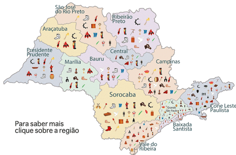
Figura 2: Mapa Cultural Paulista 14 .