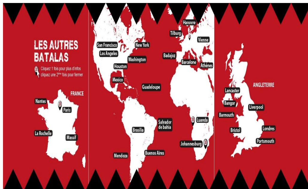
Figura 3: Distribuição geográfica da Batucada Batalá

Fonte: http://www.batalaparis.fr/ Acesso em janeiro de 2017.