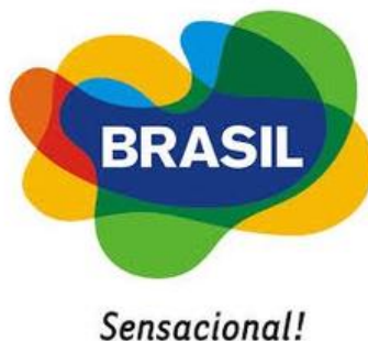
Figura 1: Marca Brasil